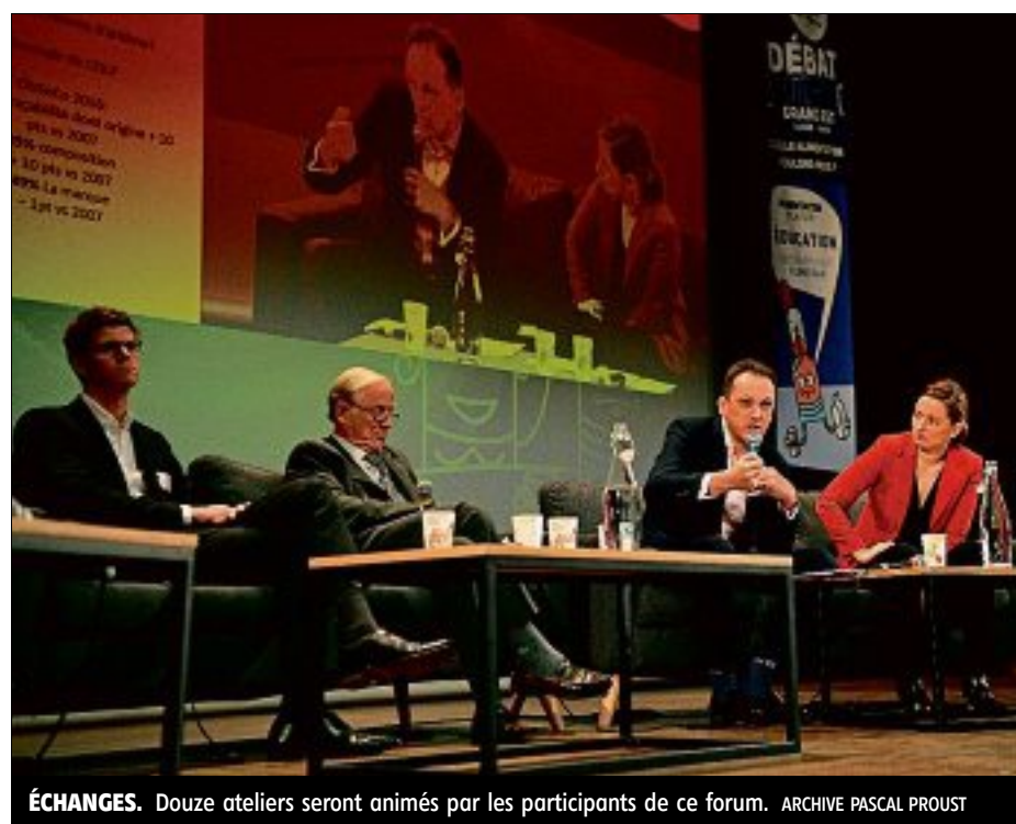
ÉCHANGES. Douze ateliers seront animés par les participants de ce forum.

Ces ateliers rassembleront, sur chaque table, un agriculteur, un transformateur, un distributeur, un restaurateur, un étudiant, un chercheur, un politi-