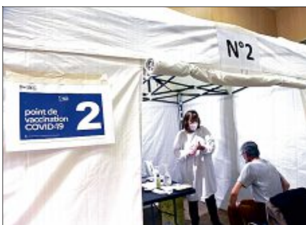
PIQUÈRE. La campagne se poursuit.

Le centre ouvrira lundi 15 février au centre Françoise-Kuyppers. Les vaccinations (150 doses par semaine) auront lieu le lundi (de 14 heures à